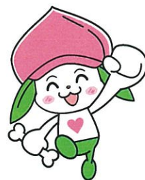
協会けんぽ福島支部マスコットキャラクター ケンタンくん